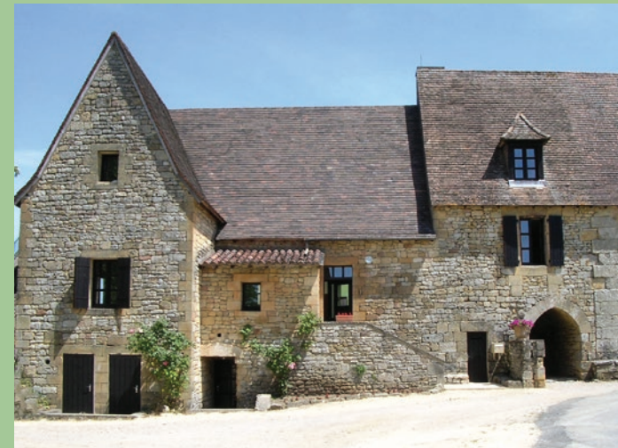
Cap Sireuil Village - Les Eyziez de Tayac 05 53 29 47 97 / www.cap-sireuil.org