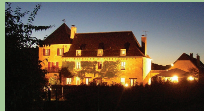
Le Manoir du Chambon - Montignac Lascaux 05 53 51 14 71 / www.manoirduchambon.org